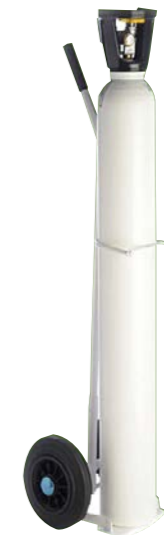
10 liter cilinder