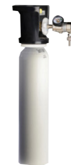
2 liter cilinder