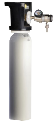
2 liter cilinder