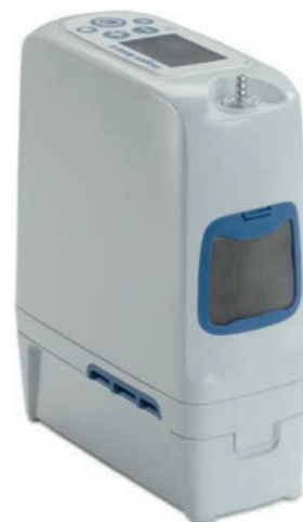
Inogen Rove 6