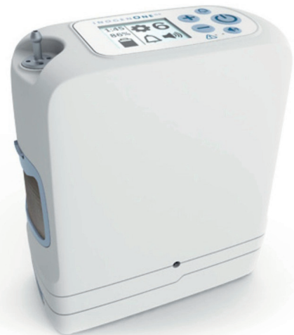
Inogen One G5